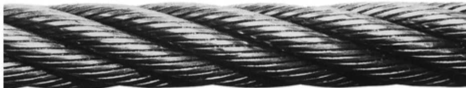
G IWRC 6xWS(31) G IWRC 6xWS(36)