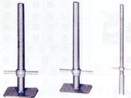
ジャッキベース 溝付ジャッキ 棒ジャッキ