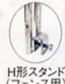
H形スタンド (フェンス用)