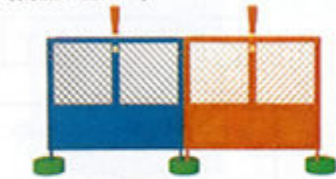
〈付属品〉脚2本・ジョイント