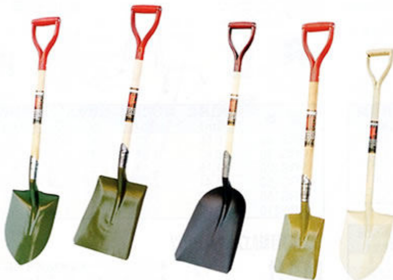
丸型 角型 石炭型 コンクリート用 園芸用